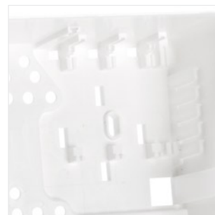
Uchwyt do montażu ekspanderów